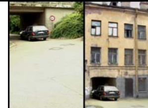
Schritt 3: Hineinkopieren in das Bild der Hausfassade.