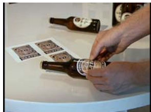
Falsche Etiketten werden am PC gestaltet und auf Bierflaschen geklebt.