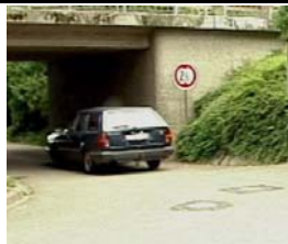
Schritt 1: Ein Fahrzeug wird aufgenommen.