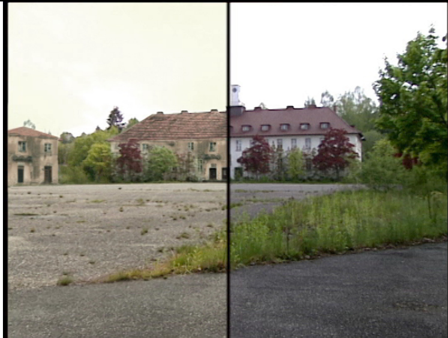
Kasernengebäude vor und nach der Bearbeitung am PC