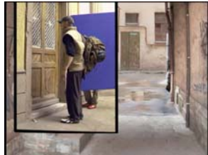
Schritt 1: Oleg wird vor einer Haustür aufgenommen.