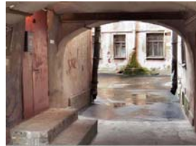
Hier der echte Eingang, in den die Haustür einkopiert wird.