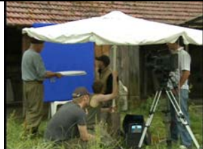
Schritt 1: Oleg wird vor einem blauen Hintergrund aufgenommen