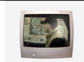
Schritt 2: Die „ausgestanzte“ Person wird in ein Bild mit Fahraufnahmen kopiert.