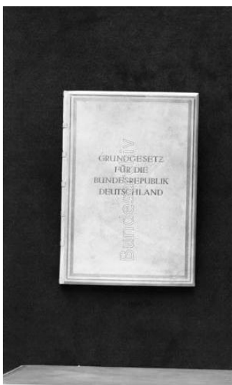
22. Juni 1964

Das Grundgesetz der Bundesrepublik Deutschland: